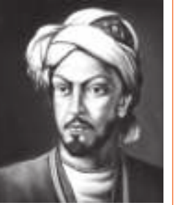
سید عمادالدین نسیمی

مسجد و میکده و کعبه و بتخانه یکی است ای غلط کرده ره کوچمه ما! خانه یکی است هرکس از جام ازل گرچه به نوعی مستند چشم مست تو گواه است که پیمانه یکی است صورت آدم و حوا به حقیقتت دام است معنی دام اگر بیافته‌ای، دانه یکی است گرچه بسیار بود قصه و افسانه عشق چون تو صاحب نظری قصه و افسانه یکی است اختلافی ز ره صورت اگر هست چه پاک آتش و شمع و شب و مجلس و پروانه یکی است هر یک از روی صفت یافته اسمی ورنه مفلس و محتشم و عاقل و دیوانه یکی است چشم احول ز خطا گرچه دو بیند یک را روشن است این که دل و دلبر و جانانه یکی است تکیه بر مستند هستی ممکن ای صاحب جاه! که در این ره بر ما گلخن و کاشانه یکی است چون نسیمی، طلب گنج بقا کن که یقین شاه و درویش در این منزل ویرانه یکی است