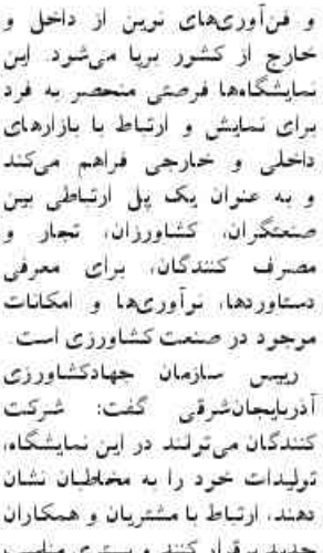
رئیس سازمان جهادکشاورزی آذربایجان شرقی گفت: این استان در حوزه ایجاد زنجیره ارزش، فرآوری، درآمدهای حاصل از صادرات و صنایع وابسته در مسیر برای توسعه و ارتقاء با بازارهای داخلی و خارجی فراهم می‌کند.

۳۰ خرداد تا ۲ تیر ماه سال جاری برای بازدید سرمایه گذاران، فعالان این حوزه و علاقه مندان در محل دایمی نمایشگاه بین المللی تبریز برپا می‌شود.