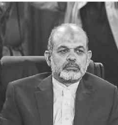
بهاجم تجویح می‌شود وی خاطرنشان کرد: این که تلاش کنیم از داخل اعداد یک تحلیل‌هایی در بیاوریم به نظر من خرافه‌زدگی است

وزیر کشور تأکید کرد: تجویح نهایی آراء اصلاً ضرب نمی‌شود بلکه جمع می‌شود، یعنی آراء تک تک صندوق‌ها با هم جمع می‌شود و در نهایت بهایم جمع می‌شود.