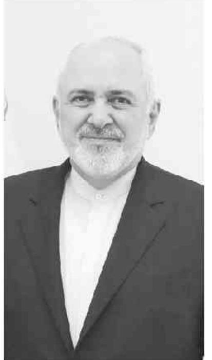
محمدجواد ظریف، معاون راهبردی دولت چهاردهم درباره گسسته زنی‌ها پیرامون حضور عباس عراقچی در وزارت خارجه دولت چهاردهم

می‌گوید: عراقچی مجری بسیار خوبی برای سیاست‌های جمهوری اسلامی بودند و در آینده هم خواهند بود. لیست نهایی شورای راهبردی چند روزیست که در دست رئیس جمهوری است و در نهایت کابینه پیشنهادی یا از میان اسامی پیشنهادی این شورا برای هر وزارتخانه جانشین خواهد شد یا با توجه به نظرات و خواسته رئیس جمهور چهره‌هایی برای این شورا وارد لیست می‌شوند. در این میان برخی چون فیاض زاهد که خود در این شورا حضور داشته است، به خیرگرایی خیر آن‌ها می‌گویند، اما امکان دارد لیست مذکور تحت فشار نهادهای امنیتی و مجلس تغییر کند. محمدجواد ظریف، رئیس شورای راهبردی و معاون راهبردی دولت پزشکیان اما نگاهی متفاوت دارد و در گفتگو به خیرگرایی خیر آن‌ها می‌گوید: «نهادهای امنیتی در نهایت می‌توانند صلاحیت افراد را تأیید یا رد کنند» گفته‌های او درباره معرفی عباس عراقچی به عنوان وزیر خارجه نیز از دیگر سوالاتی بود که از ظریف می‌پرسیم و او گرچه این گفته را رد