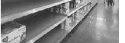
بعد از حدوداً یک ماهی که از قحطی شیر خشک نورآردان در داروخانه‌ها می‌گذرد، پیرو انتشار گزارش‌هایی که از تولیدکنندگان و اعضای مجلس شورای اسلامی از کمبود شیر خشک در داروخانه‌ها و ناترازی در تخصیص ارز به تولیدکنندگان شیر خشک از سوی سازمان غذا و دارو در این رسیده منتشر شد، امروز شرایط توزیع و فراوانی شیرخشک در داروخانه‌ها بهتر از قبل شده است.

متأسفانه در قفره واردات شیر خشک توسط شرکت‌های فروشی سه هزار و ۵۰۰ میلیارد تومان