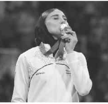
دختر تکراندوکار در مورد میزبانی تصریح کرد: دهکده تعریفی نداشت اما سالن رقابت‌های تکراندو خیلی با شکوه بود ما را به وجد آورده بود و فکر می‌کنم در موفقیت این تاثیرگذار بود او در پایان گفت: همه در این مسیر به ما کمک کردند. موفقیت را تنها کسب نکردم و یک ملت پشت من بود، دست تک تک مردم را می‌برسم.